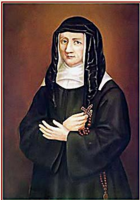
Imagen de Luisa de Marillac

en 94 países con aproximadamente 21.000 miembros.