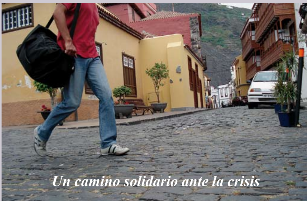
Un camino solidario ante la crisis

Una edición especial para que conozcas las actividades y programas que se están realizando en Servicios Sociales, Formación y Empleo del ayuntamiento de Garachico para hacer frente a la actual crisis económica y social que afecta al municipio