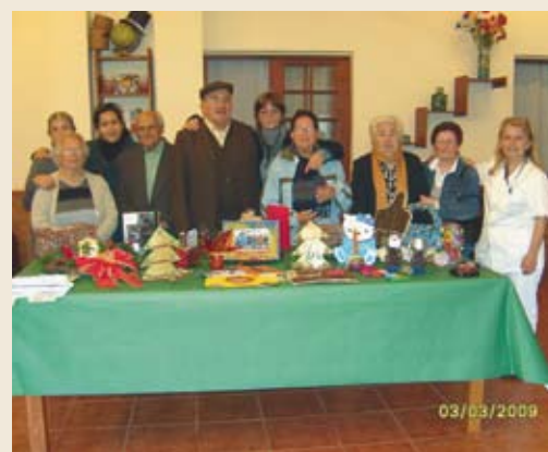
Residentes del Centro de Día

El lugar cuenta -además- con ascensor, sala de estar, sala de televisión y lectura. Dispone de jardines y un patio espléndido magnificado en belleza y funcional en un enclave privilegiado.