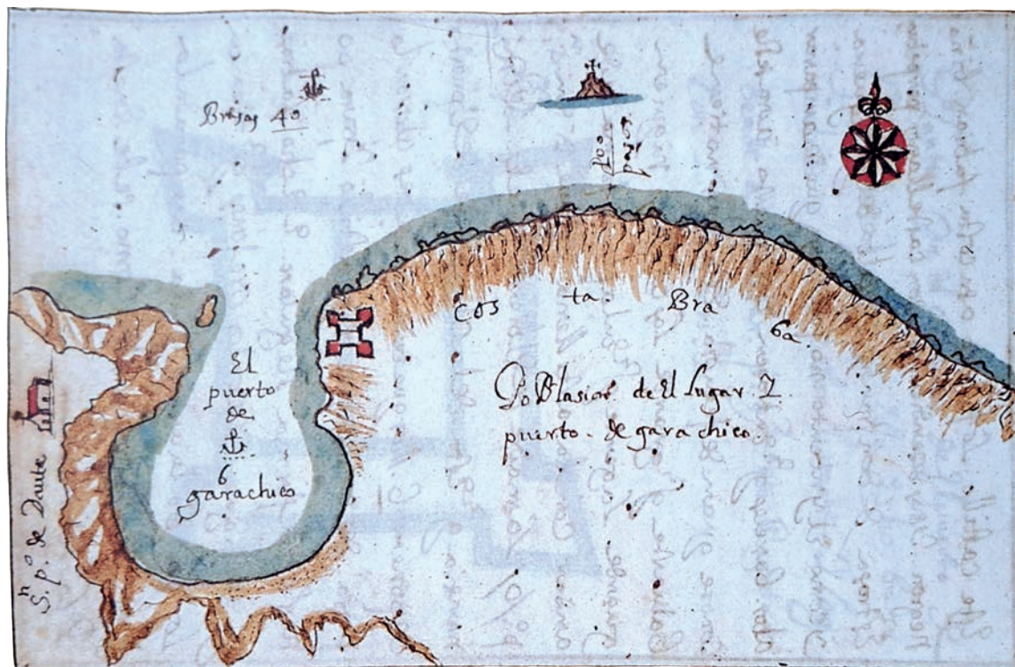
Plano de Garachico realizado por el ingeniero militar Lope de Mendoza (1669).

Sabido es que los siglos XVI y XVII constituyeron la época dorada de la historia de Garachico. La prosperidad económica del lugar se basó en la consolidación de su rada como puerto principal de Tenerife a través de un considerable tráfico comercial con Europa, América y África. Mercancías de todo tipo entraban y salían. Se exportaba principalmente productos agrícolas, especialmente azúcar y vino, pero también otros como cueros curtidos, brea o tejidos de seda isleños. De Europa se importaban telas de Inglaterra o de Francia, obras de arte flamencas y diversos productos manufacturados, incluso de contrabando, de distinta procedencia. De América llegaba el añil, el oro y la plata, de Oriente las especias y de África esclavos de Guinea y Angola. Al calor del auge portuario se produjo el paulatino desarrollo urbano de Garachico, sobresaliendo entre sus construcciones los magníficos edificios religiosos -sólidos y espaciosos- de iglesias y conventos.