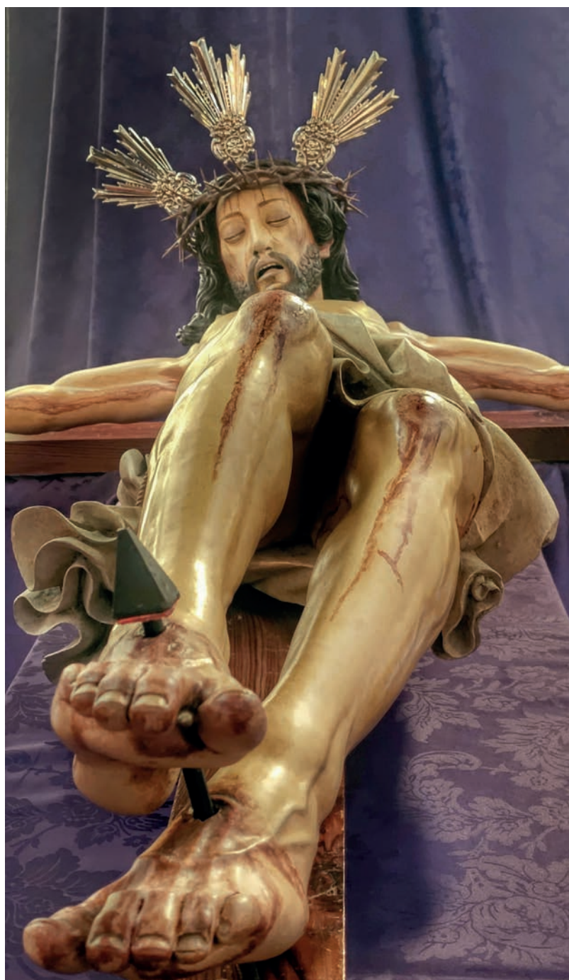
Crucificado del tabernáculo del altar mayor de la iglesia de Santa Ana de Garachico, obra de Martín de Andújar (siglo XVII).

Esta consideración de Garachico como puerto principal de Tenerife y la mucha concurrencia de navíos de todas las nacionalidades en él, también condicionaría la observancia de los deberes espirituales y penitenciales propios del tiempo de Cuaresma y Semana Santa, asegurándose las autoridades eclesiásticas de que, a pesar de las largas travesías, los