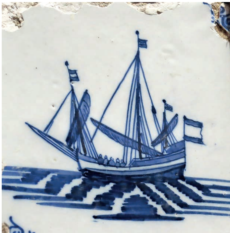
Antigua cruz que remataba la portada principal de la iglesia franciscana de Nuestra Señora de los Ángeles de Garachico, custodiada hoy en la parroquial de Santa Ana, realizada con azulejos de Delft, ciudad holandesa con una importante industria cerámica desde finales del siglo XVI, desarrollada a partir del siglo XVII.